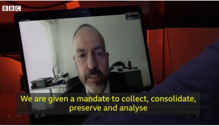
ယန္တရား အကြီးအကဲကို ဘီဘီစီက အွန်လိုင်းမှ ဆက်သွယ်မေးမြန်းနေပုံ