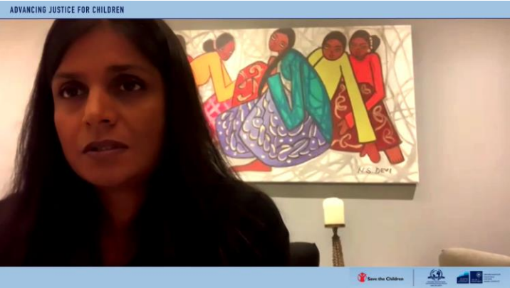
ကလေးများအတွက် တရားမျှတမှုဆိုင်ရာ ပညာရှင်ဆွေးနွေးပွဲမှ ရိုက်ကူးချက်

ယန္တရားသည် ဒီဂျစ်တယ်ခေတ်တွင် လူ့အခွင့်အရေးများနှင့် ပတ်သက်ပြီး နှစ်စဉ်ကျင်းပသည့် ရိုက်ကွန်း (RightsCon) ထိပ်သီးညီလာခံတွင်လည်း တက်ရောက်ဆွေးနွေးခဲ့သည်။ အထူးသဖြင့် “နိုင်ငံသားများဦးဆောင်သည့် စုံစမ်းစစ်ဆေးမှုများ၊ လူမှုအသိုက်အဝန်း အခြေခံ အုပ်ချုပ်မှု၊ နှင့် အပြည်ပြည်ဆိုင်ရာ ယန္တရားများနှင့် ထိရောက်သော အပြန်အလှန် ဆွေးနွေးပွဲ၊ နိုင်ငံအခြေခံ စုံစမ်းစစ်ဆေးမှုများဖြင့် မလုံလောက်သည့်အခါ သက်သေအထောက်အထား ပြုစုစုဆောင်းရေး၏ စိန်ခေါ်မှုများ” ဟု ခေါင်းစဉ်တပ်ထားသည့် အဖွဲ့ဆွေးနွေးပွဲတစ်ခုတွင် တက်ရောက် ဆွေးနွေးခဲ့ပါသည်။ ဆွေးနွေးပွဲတွင် အမျိုးမျိုးသော နိုင်ငံသား-ဦးဆောင်သည့် သက်သေအထောက်အထား ပြုစုစုဆောင်းခြင်းဆိုင်ရာ ကြိုးပမ်းမှုများ၊ ဤကဏ္ဍရှိ အမျိုးမျိုးသော အရပ်ဖက်ဆောင်ရွက်ပေးသူများအား အထောက်အကူ ပြုနိုင်ပုံများကို အလေးထား ဆွေးနွေးခဲ့ကြသည်။