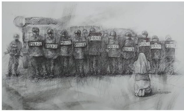
မကြာသေးခင်က တွေ့ရသည့်ဆန္ဒပြမှု မြင်ကွင်း (ပုံကို ချင်းလေး ရေးဆွဲ)

ကျန်ပဲတို့အား ပေးပို့လာသည့် သတင်းအချက်အလက်များကို လက်ခံရှိကြောင်း အသိပေးလိုပါသည်။ ထို့အပြင် ဤမျှ များပြားသည့် သတင်းအချက်အလက်များကို ပေးပို့လာသည့် မြန်မာလူထု၏ စွမ်းရည်သတ္တိကိုလည်း ကျန်ပဲတို့ အသိအမှတ်ပြုပါသည်။ ဤအချက်နှင့်စပ်လျဉ်း၍ ယန္တရားသည် သတင်းအချက်အလက် ပေးပို့လိုသူများအား ဆက်လက်၍ အသိပေးလိုသည်မှာ သတင်းအချက်အလက် ပေးပို့သူတို့၏ ဘေးအန္တရာယ် ကင်းရှင်းရေးနှင့် လုံခြုံရေးသည် အဆုံးစွန်ဆုံး အရေးကြီးဆုံးဖြစ်ပြီး၊ ၎င်းတို့အနေဖြင့် အချက်အလက် ပေးပို့ရန်အတွက် လုံခြုံရေး စိတ်ချရသည့် အခါနှင့် ဘေးအန္တရာယ် ကင်းမှသာ ယန္တရားသို့ ပေးပို့သင့်ပါသည်။