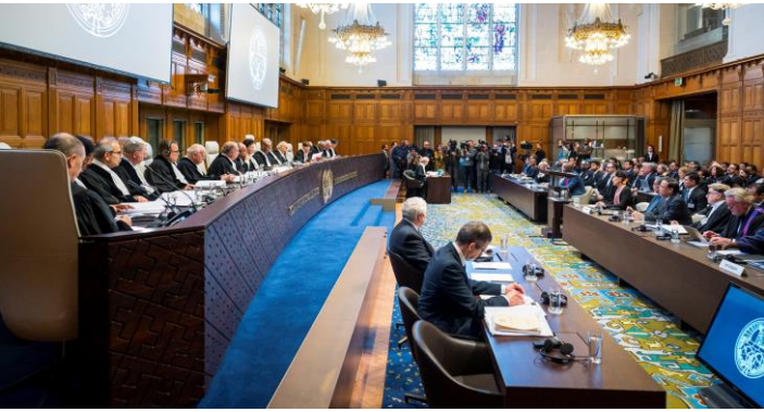
ဂမ်ဘီယာနှင့် မြန်မာအမှုကို အိုင်စီဂျေတွင် ကြားနာမှုစတင် ဖွင့်လှစ်ခြင်း

(၂၀၂၀) ခုနှစ် နိုဝင်ဘာလ (၁၁) ရက်နေ့တွင်၊ ဂမ်ဘီယာနိုင်ငံသည်- အစ္စလာမ်ပူးပေါင်းဆောင်ရွက်ရေးအဖွဲ့ (Organisation of Islamic Cooperation, OIC) အဖွဲ့ဝင် (၅၇) ဖွဲ့၏ ထောက်ခံမှုဖြင့် အပြည်ပြည်ဆိုင်ရာ တရားရုံး (ICJ) သို့ အမှုတင်သွင်းခဲ့သည်။ ရခိုင်ပြည်နယ်ရှိ ရိုဟင်ဂျာများအပေါ် ကျူးလွန်သည့် ရာဇဝတ်မှုများသည် လူမျိုးပြုန်းတီးစေမှု တားဆီးရေးနှင့် ပြစ်ဒဏ်ပေးရေးဆိုင်ရာ သဘောတူညီချက် စာချုပ် (“ဂျန်နိုဆိုက် ကွန်ဗင်းရှင်း”) အား ဖောက်ဖျက်သည်ဟု အမှု၌ စွပ်စွဲထားသည်။ ဂမ်ဘီယာနိုင်ငံသည် စာချုပ် အပိုဒ် (၉) အရ အမှုကို တင်သွင်းခဲ့သည်။ ၎င်းအပိုဒ်အားဖြင့် “လူမျိုးပြုန်းတီးစေမှုအတွက် တိုင်းပြည်တစ်ခုတွင်ရှိသော တာဝန်ဝတ္တရားနှင့် ပတ်သက်၍” နိုင်ငံများအကြား အငြင်းပွားမှုများကို ICJ တရားရုံးသို့ တင်သွင်းရန် ခွင့်ပြုထားသည်။ မြန်မာနိုင်ငံသည် (၁၉၅၆) ခုနှစ် ကတည်းကစ၍ ဂျန်နိုဆိုက် ကွန်ဗင်းရှင်း သဘောတူညီချက်တွင် ပါဝင်သော အဖွဲ့ဝင်နိုင်ငံ ဖြစ်သည်။ အိုင်စီဂျေ တရားရုံးရှေ့မှောက်ရှိ ဂမ်ဘီယာနိုင်ငံနှင့် မြန်မာနိုင်ငံ အမှုသည် ကမ္ဘာ့ကုလသမဂ္ဂ ပဋိညာဉ်စာတမ်း၊ ICJ ပြဌာန်းဥပဒေနှင့် လူမျိုးပြုန်းတီးစေမှု စာချုပ်တို့တွင် အဖွဲ့ဝင်ဖြစ်သည့် ကုလသမဂ္ဂ အဖွဲ့ဝင်နိုင်ငံများအကြား “နိုင်ငံတခုမှ နိုင်ငံတခုသို့” တရားစွဲဆိုမှုဖြစ်သည်။ ဂမ်ဘီယာနိုင်ငံနှင့် မြန်မာနိုင်ငံ၏ တောင်းခံမှုကြောင့် ယန္တရားသည် သက်ဆိုင်ရာ အချက်အလက်များပေးအပ်ခြင်း လုပ်ငန်းစဉ်ကို စတင်နေပြီ ဖြစ်သည်။ (၂၀၂၀) ခုနှစ်၊ စက်တင်ဘာလ (၂) ရက်နေ့တွင် ကနေဒါနိုင်ငံနှင့် နယ်သာလန်နိုင်ငံတို့သည် ဤအမှု၌ ဝင်ရောက်ပါဝင်ရန် ဆန္ဒရှိကြောင်း ကြေညာခဲ့ပါသည်။ မောလဒိုက်စ်နိုင်ငံသည်လည်း ဝင်ရောက်ပါဝင်ရန် ၎င်း၏ဆန္ဒကို (၂၀၂၀) ခုနှစ်၊ ဖေဖော်ဝါရီလ ကတည်းက ကြေညာထားသည်။