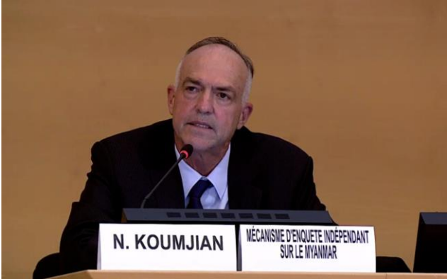
မြန်မာနိုင်ငံဆိုင်ရာ ယန္တရား၏ အစီရင်ခံစာ တင်ပြမှုနှင့် အပြန်အလှန် ဆွေးနွေး ပြောဆိုပွဲ ကို UN Web TV တွင် ကြည့်ရှုပါ။

ယန္တရားမှ ကမ္ဘာ့ကုလသမဂ္ဂ လူ့အခွင့်အရေးကောင်စီသို့ တင်သွင်းသည့် ၎င်း၏ ဒုတိယအကြိမ် နှစ်ပတ်လည် အစီရင်ခံစာ တွင်၊ ယန္တရားကို ဖွဲ့စည်းပြီး ပထမ တစ်နှစ်အတွင်း သိသာထင်ရှားသော တိုးတက်မှုကို ဖော်ပြထားပြီး၊ ယန္တရား၏ မစ်ရှင်ကို ဆက်လက်ထောက်ခံပေးရန်အတွက် အဖွဲ့ဝင်နိုင်ငံများအား ထပ်လောင်း တောင်းဆိုခဲ့သည်။ 5 အဆိုပါ အစီရင်ခံစာကို အထွေထွေညီလာခံသို့လည်း တင်သွင်းခဲ့ပါသည်။ 6