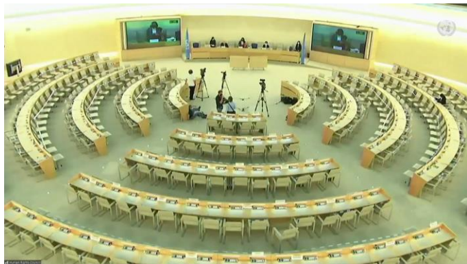
ယန္တရား၏ အစီရင်ခံစာ တင်သွင်းမှုနှင့် ပြန်လှန် မေးမြန်းခန်းကို UN Web TV တွင် ကြည့်ရှုနိုင်ပါသည်။

ကုလသမဂ္ဂ လူ့အခွင့်အရေးကောင်စီသတို့ တင်သွင်းသည့် တတိယ နှစ်ပတ်လည်အစီရင်ခံစာ တွင် ယန္တရားက အဖွဲ့စတင်လည်ပတ်စဉ်မှ စ၍ လုပ်ဆောင်ခဲ့သော အခြေခံ ပန်းတိုင်များ၊ ဆက်လက် အကောင်အထည်ဖော်မည့် လုပ်ငန်းစဉ်များအား ရှင်းပြခဲ့ပါသည်။ ထို့အပြင် မြန်မာနိုင်ငံအတွင်း ကြီးလေးသော နိုင်ငံတကာရာဇဝတ်မှု ကျူးလွန်ခဲ့သူများအား တရားခွင့်ရှေ့မှောက် တရားစီရင်ခံရေး အထောက်အကူပြုနိုင်အောင် ပူးပေါင်းဆောင်ရွက်မှုများ၊ ယန္တရား လည်ပတ်မှုအားကောင်းစေရန် တိုးမြှင့်ဆောင်ရွက်မှုများအား ရှင်းလင်းတင်ပြခဲ့ပါသည်။ မြန်မာနိုင်ငံအတွင်းရှိ ရိုဟင်ဂျာ လူမျိုးများအား ညှဉ်းပန်းမှုများ အပါအဝင် အခြေအနေအရပ်ရပ်ကို စုံစမ်းစစ်ဆေးရာတွင် အထောက်အကူပြုစေရန် အဖွဲ့အစည်းအတွင်းရှိ ကျွမ်းကျင်မှုနှင့် အရင်းအမြစ်များကို ဗျူဟာကျကျအသုံးပြုနိုင်စေရန် ဆောင်ရွက်နေမှုများအားလည်း ဆက်လက်ရှင်းပြခဲ့ပါသည်။ ၎င်းအစီရင်ခံစာကို အထွေထွေညီလာခံသို့လည်း ပေးပို့ ခဲ့ပါသည်။